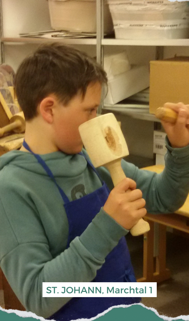
ST. JOHANN, Marchtal 1