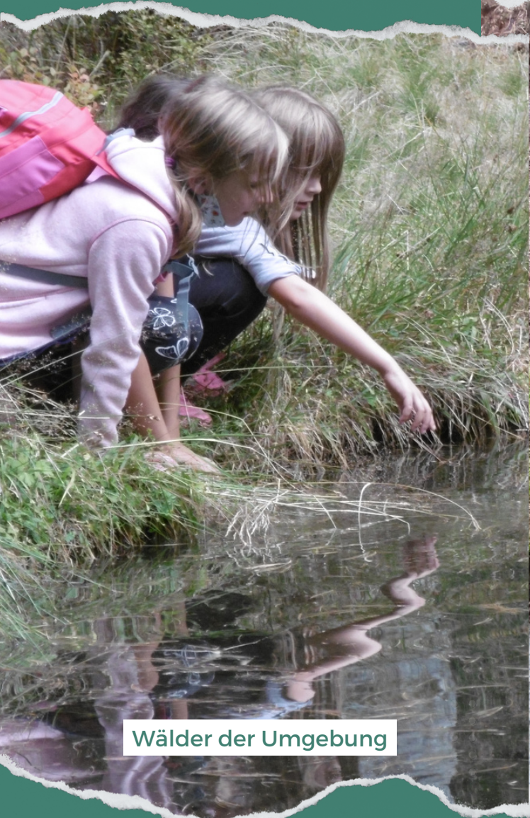
Wälder der Umgebung